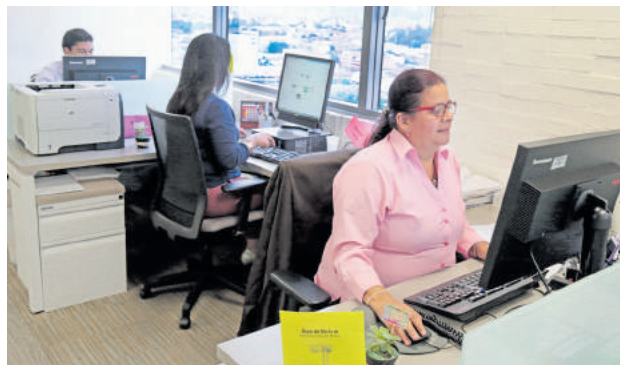
En los últimos dos años Comedal se ha expandido a Valledupar, Pereira, el sector El Poblado en Medellín, Barranquilla y Bogotá.